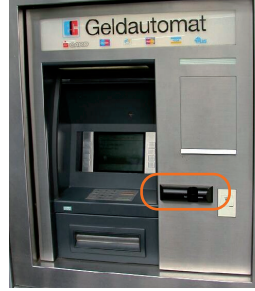
Kartenleservorbau an einem Geldautomaten

Ein Klemm-Mechanismus hält die Karte zurück. Dann wird die Geheimnummer ausgespäht oder durch einen „Helfer“ erfragt.