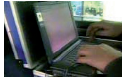
Daten werden per Funk auf ein Notebook übertragen