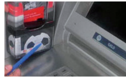
Mini-Kamera zum Ausspähen der PIN